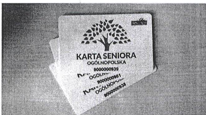
Ogólnopolska Karta Seniora

Bez wsparcia finansowego samorządów lub Waszego nie jesteśmy w stanie pokrywać kosztów realizacji i dalszego rozwoju Programu.